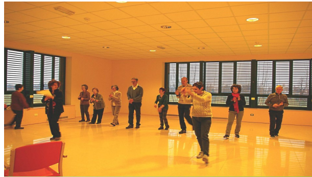
Durante la lezione di Musicoterapia