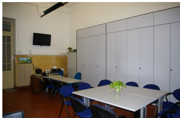
La Nuova sede della Tartaruga onlus