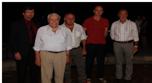
25 agosto 2012, San Zeno.