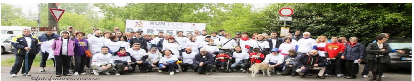
RUN FOR PARKINSON 2012