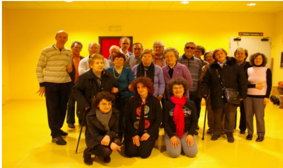
Gruppo di Musicoterapia