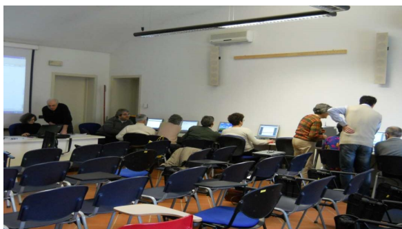
Un momento del corso d'informatica.