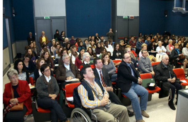
Pubblico presente al convegno del 2012