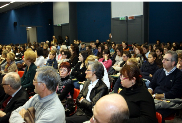
Pubblico presente al convegno del 2012