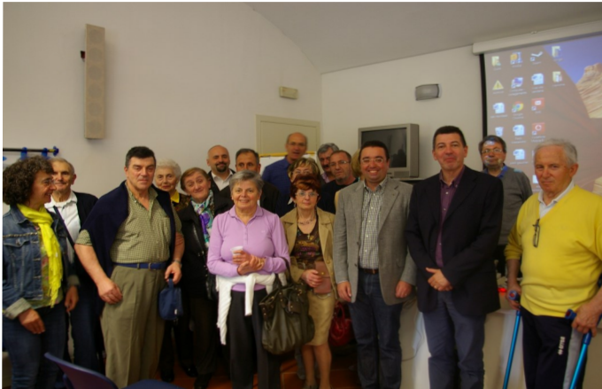
Soci presenti all'incontro del 11 maggio 2013