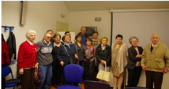
Incontro del 20 aprile 2013