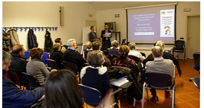
Incontro del 2 marzo 2013