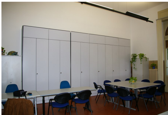
La Nuova sede della Tartaruga onlus