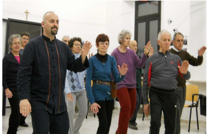
Corso di Tai Chi Chuan del 2012